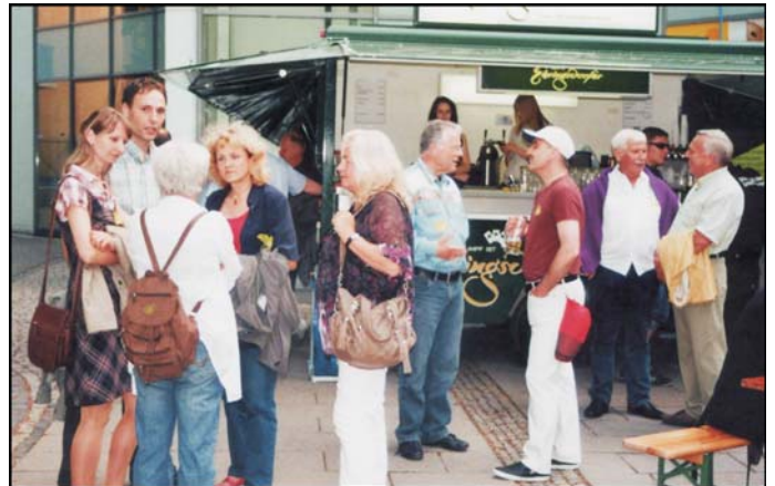
Zwischenstopp am mobilen Tresen der „Ehringsdorfer Brauerei“

Da viele von uns eine weite Heimreise hatten, stand am Sonntagmorgen der Besuch der „Herzogin Anna- Amalia- Bibliothek“ als einziges Ereignis auf dem Programm. Hier ersetzt die Technik den Menschen (Bibliotheksführer), was ich persönlich nicht schön finde, wohl wissend, dass diese Methode immer üblicher wird, aber Technik kann einen interessanten Führer nicht ersetzen! Dieser Besuch war aber trotzdem eine interessante Erfahrung für mich, wie auch viele kurze persönliche Kontakte zu den Weimerern den Einheimischen und deren riesengroßen Stolz auf ihre schöne Stadt Weimar, den man förmlich spüren konnte. Als Weltkulturstadt erhielt Weimar Geld von der EU, das zum Wiederaufbau und zur Ausbesserung der historischen Gebäude genutzt wird. Auf diesem Wege möchte ich mich im Namen der Reisegruppe „GK - auf Abwegen“ bei den Organisatoren dieses Wochenendes bedanken.