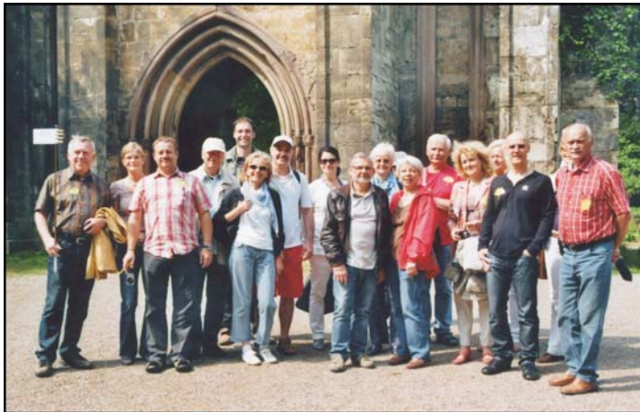
vor der Ruine des Tempelherrenhauses im Park an der Ilm