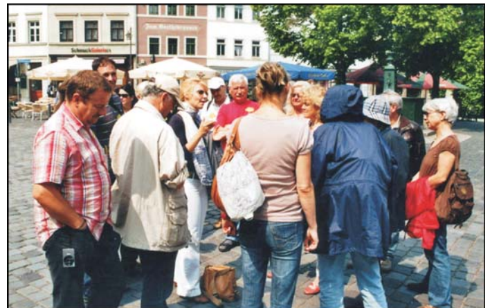
am Frauenplan in der Nähe von Goethes Wohnhaus