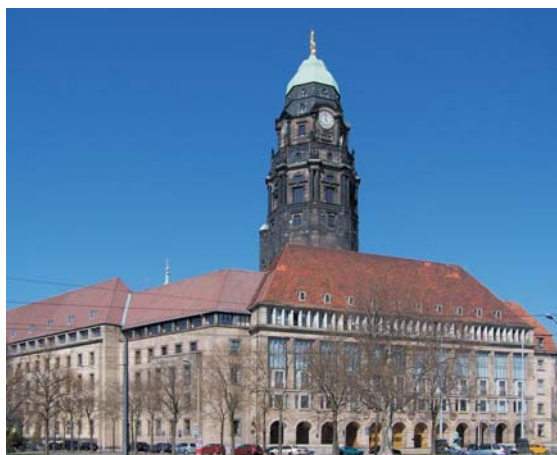
das Neue Rathaus Dresden

Für den Heimweg ist keine festgelegte Zeit angesetzt, Sie können also selbst entscheiden, wann Sie den Abend beenden wollen. Für den Weg zum Hotel stehen Ihnen die Fahrmobile der DVB und Taxi-Unternehmen zur Verfügung.