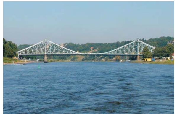
„Blauer Wunder“ in Dresden

Im der Wahl vorausgehenden Rechenschaftsbericht werden wir von ihr erfahren, wie die Vorstandsarbeit des vergangenen Jahres verlief, welche Erwartungen sie hatte und sie wird uns Antwort geben, ob sie sich ein weiteres Mal für dieses Amt zur Wahl stellen wird.