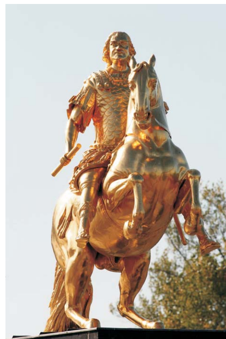
der „Goldene Reiter“ in Dresden

Wir weisen noch einmal darauf hin, dass die verlängerte Frist für die Zimmerreservierung im Tagungshotel am 30. September 2011 endet!