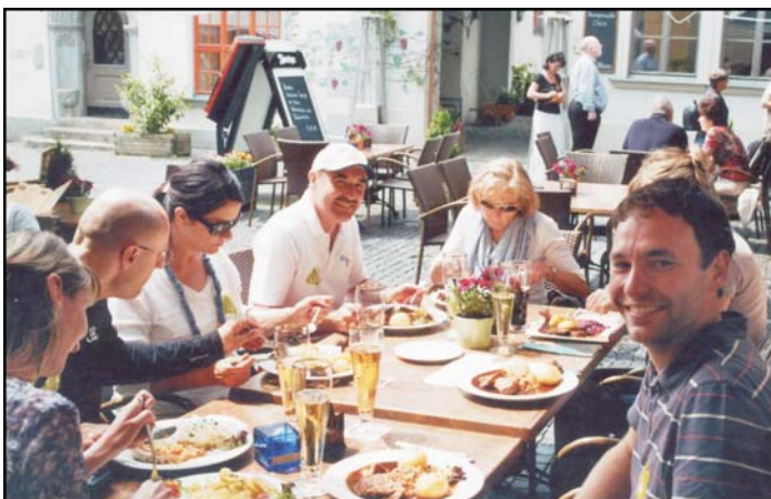
Stärkung im „Schwarzbierhaus“

unserer zweistündigen Stadtführung bildete der Theaterplatz mit dem Deutschen Nationaltheater, vor dem Goethe und Schiller als Denkmal gemeinsam auf den Sockel stehen. Das Mittagessen war für 12.30 Uhr in der Gaststätte „Schwarzbierhaus“ bestellt. Da wir, wie bereits erwähnt, ein super Wetter hatten, saßen wir draußen und genossen zünftige Thüringer Küche ( am meisten ging Thüringer Bratwurst mit Sauerkraut). Danach hatten wir Tagesfreizeit, die jeder nutzen konnte, wie er wollte und um 17.30 Uhr fanden wir uns zum Abendessen im Restaurant „Shakespeare“ ein. Für die 20.00 Uhr- Vorstellung im „Galli- Theater“, das sich gleich unter den Restaurant befindet, hatten wir Eintrittskarten.