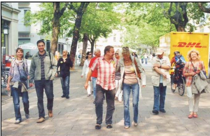
auf der Schillerstraße