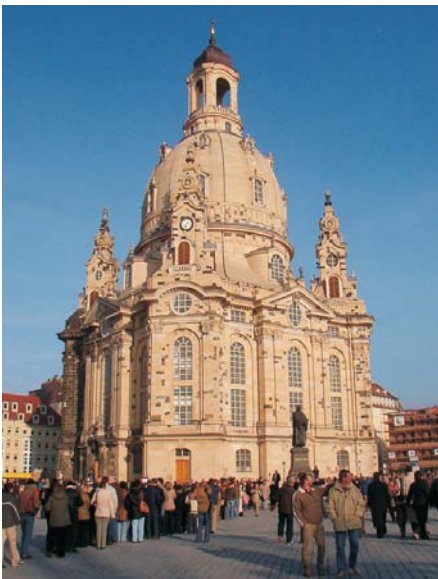
Frauenkirche in Dresden

Nun sind es nur noch wenige Wochen bis unser 21. Harzer Fortbildungsseminar in Dresden stattfindet.